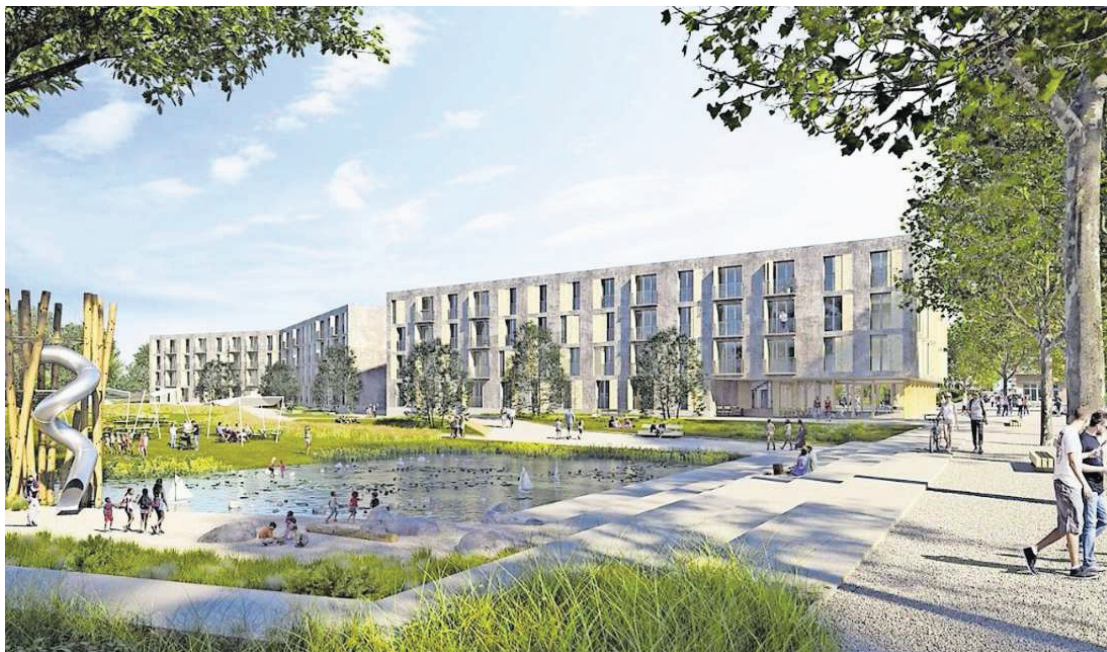
Die Überbauung Huebergass mit insgesamt 103 Wohnungen im Quartier Holligen im Westen Berns ist mehrheitlich auf Familien ausgerichtet. (Visualisierung)

Zwei junge Genossenschaften in Bern stehen als Modell für neue Formen des gemeinnützigen Wohnungsbaus. Geburtshilfe leistete ein privater General- unternehmer. Von David Strohm