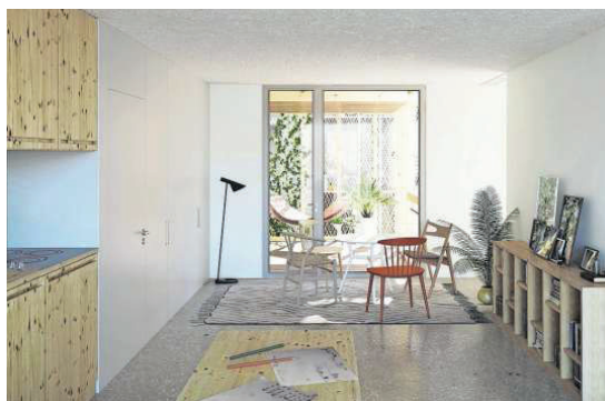
Das Projekt Huebergass beinhaltet auch Wohnateliers und Cluster-Wohnungen.

Ungewöhnlich an diesem Wettbewerb war das Vorgehen. Statt wie andernorts üblich, zuerst einen Bauträger auszuwählen, ihm das Grundstück im Baurecht abzugeben und ihn zu einem abschliessenden Architekturwettbewerb zu verpflichten, entschieden sich die Verantwortlichen in Bern für einen anonymen Wettbewerb mit Teams aus Planern und Investoren. Dass hinter dem siegreichen Projekt mit der Halter AG ein Immobilienentwickler steht, gab Anlass zu kontroversen Diskussionen innerhalb der etablierten Wohnbaugenossenschaf-